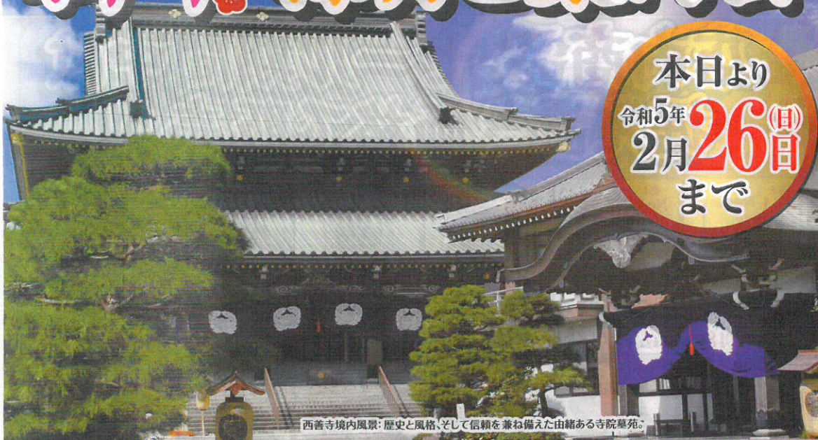
西善寺境内風景：歴史と風格、そして信頼を兼ね備えた由緒ある寺院墓苑。